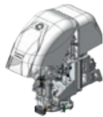
Automatischer pneumatischer Gehäusehub mit doppelter Öffnung.

Mit dem ständigen Ziel, die Maschinen zu verbessern, behält sich die FKgroup das Recht vor, ihre technischen oder funktionellen Eigenschaften ohne vorherige Ankündigung zu ändern.