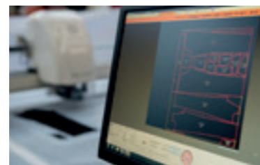
Das Werkzeug ISO Editor ändert die Platzierungen, die Position der Figuren, Kerben und Löcher.