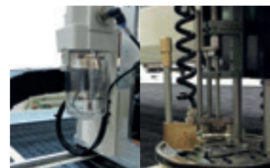
Klingenkühl- oder Schmiersystem je nach Gewebe.